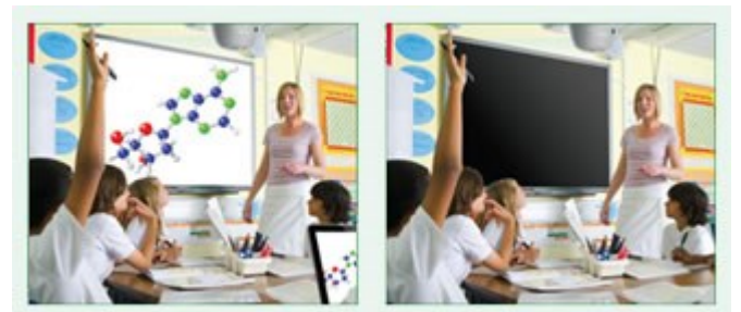
Eco AV Mute Funktion aus 100% Stromverbrauch

Behalten Sie während Ihrer Präsentation mit der ECO-AV-Mute-Funktion die Kontrolle. Richten Sie die Aufmerksamkeit Ihres Publikums durch Ausblenden weg von der Leinwand, wenn das Bild nicht benötigt wird. Dies reduziert den Stromverbrauch unmittelbar um bis zu 70%, und verlängert darüber hinaus die Lebensdauer Ihrer Lampe.